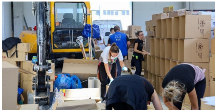
Slika 3 - Stručnjaci IOM-a podržavaju lokalne napore za uspostavljanje mehanizma upravljanja skladištem

IOM će podržati brze procjene potreba, uključujući MIRA, zajedno sa drugim agencijama UN-a, kroz timove DTM popisivača i ekspertizu odgovora na katastrofe. Kako potrebe budu rasle, IOM će obnoviti nabavku i isporuku hrane i NFI. Pored aktivnosti za oporavak od nepogode, IOM ima za cilj da proširi i svoje programe smanjenja rizika od katastrofa i izgradnje otpornosti zajednice na pogođena područja kao srednjoročni i dugoročni cilj