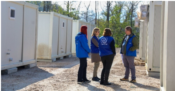
Slika 2 - Šefica misije IOM-a tokom terenske posjete privremenim prihvatnim objektima za raseljene u Konjicu

Pored angažovanja stručnjaka za koordinaciju i upravljanje kampom (CCCM) da pomognu u postavljanju privremenog prihvatila u Jablanici, IOM je proširio rad i na Konjic. U koordinaciji sa Civilnom zaštitom i Općinom Konjic, IOM pruža pomoć u postavljanju doniranih kontejnera i obezbjeđuje izgradnju kapaciteta za upravljanje privremenim prihvatnim smještajem za inicijalnih 10 porodica raseljenih usljed poplava i klizišta.